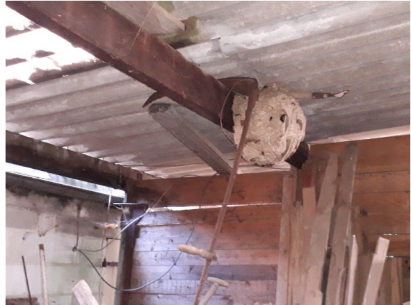
Figure 11: ne pas regarder seulement dans les arbres !

En regardant à travers les jumelles par dessus la ferme et les écuries, j'ai vu des frelons entrer dans un hangar. Lorsque j'ai sonné à la porte, il s'est avéré que les résidents connaissaient le nid depuis plusieurs semaines. Dans ce cas, les frelons ne s'étaient pas déplacés vers la cime des arbres au printemps, mais ont élargi leur nid principal en un grand nid.