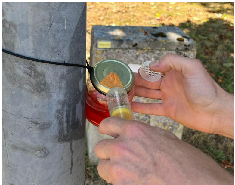
Figure 3: libération d'un frelon sur un pot à mèche

La mesure du temps de vol qui donne la distance au nid, n'est réalisée que sur le premier pot. Les déplacements se font ensuite en suivant la direction de vol, de manière à arriver au nid en quelques étapes. De préférence, la distance entre deux emplacements successifs est suffisamment courte pour que le frelon ne s'égaré pas (par exemple, 100 mètres). La première fois qu'un frelon s'envole d'un nouvel emplacement, il réalise des cercles concentriques pour se réorienter afin de regagner son nid. La direction de vol ne doit pas être prise en compte lors de ces vols d'orientation car elle n'est généralement pas fiable.